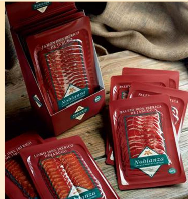
J1012 - J2012 - J4112

Les produits en tranches Noblanza sont coupés à la main et présentés sous-vide