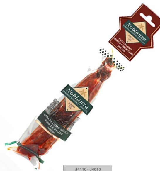
J4110 - J4010