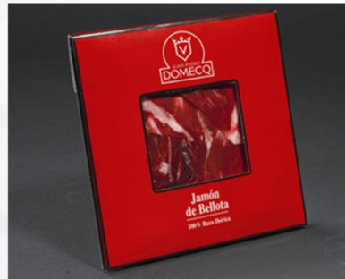
C1002 - C1102 - C1202 - C1302 C1402 - C1502 - C1602 - C1702