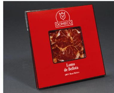
C4402 - C4502 - C4602 C4702 - C4802