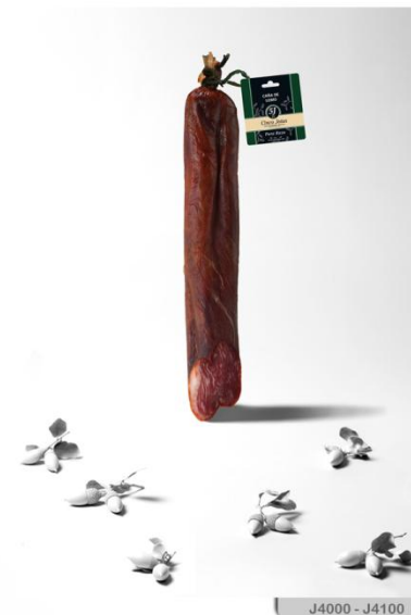
J4000 - J4100