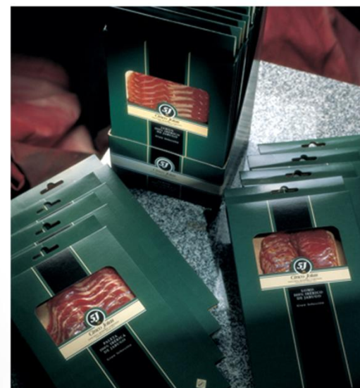
J1002 - J2002 - J4002

LES TRANCHES SONT COUPÉES FINEMENT À LA MAIN, UNE PAR UNE, PAR DES EXPERTS MAÎTRES COUPEURS